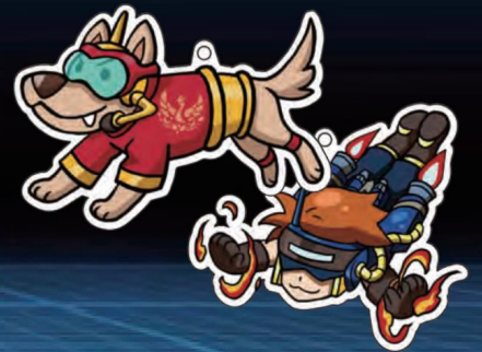
防災特攻造型一卡通 ($100)