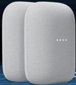
Google Nest Audio 智慧音箱